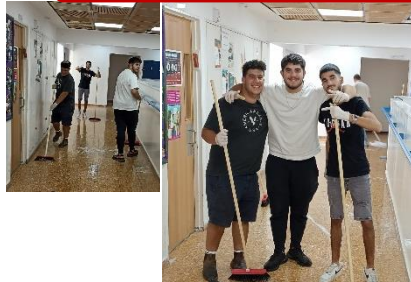
תלמידי כיתה יב' לוקחים אחריות ומנקים את בית הספר. מנהיגות ואחריות. כבר אמרנו?