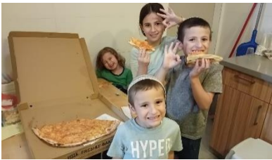
משפחות המורים המגויסים מקבלות פיצה חמה, לעידוד